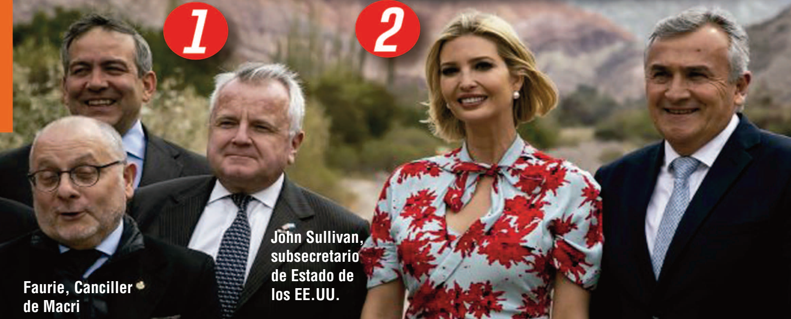
Faurie, Canciller de Macri